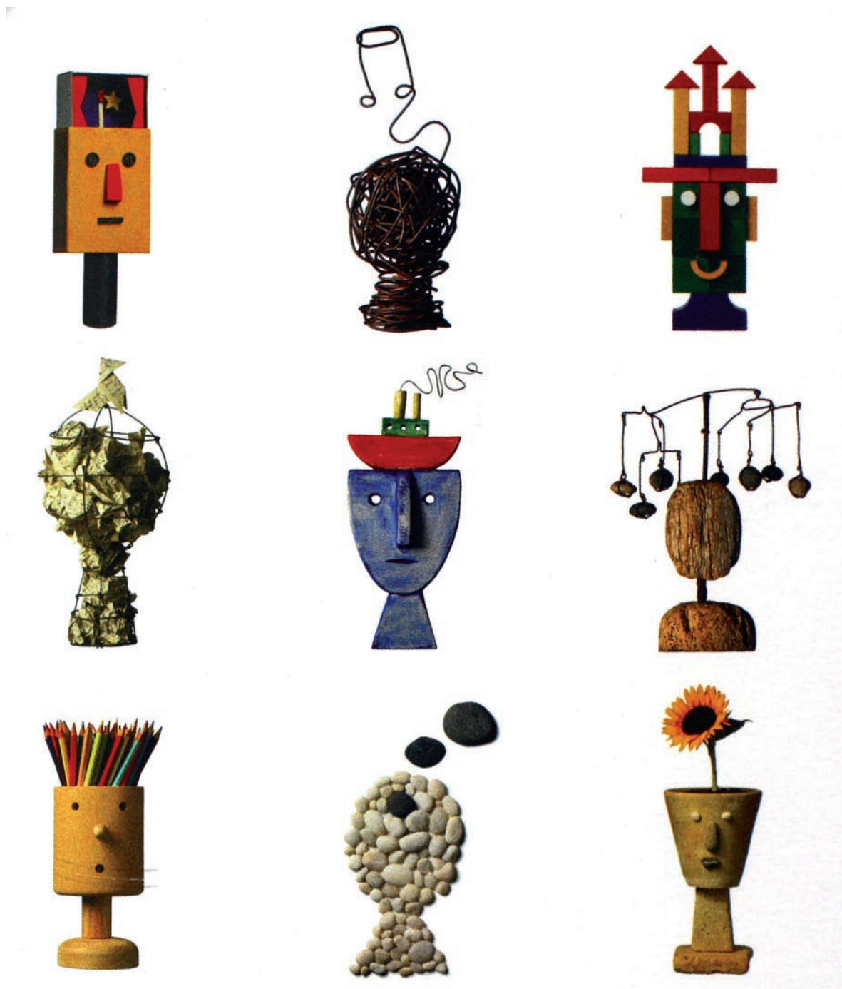
Imaxe 1: Colección de “cabezas pensantes”. Deseño: Carlos Sánchez Lacaste (ilustracións : Pep Carrió, proxecto gráfico: José Luís de Hijes, fotografías: Enrique Cotarelo)